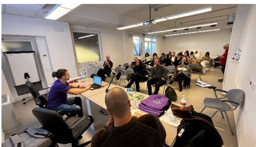
Imersão 2024 nos Sistemas de Saúde da Região da Emília-Romana