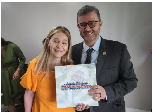
Produção de jogos educacionais com foco na Saúde do Idoso.