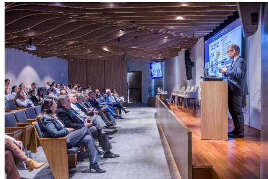
Organização do Grand Round Internacional da Moinhos de Vento