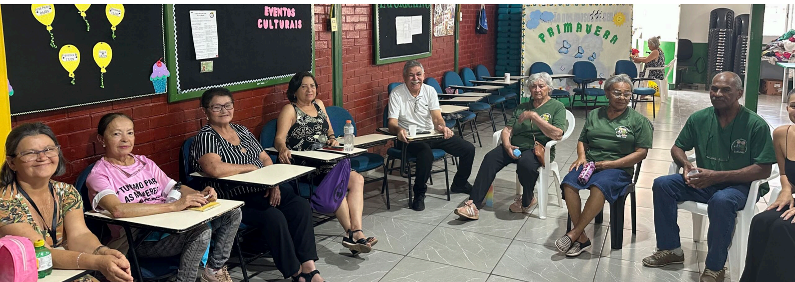
Projeto Escuta Sensível na Associação de Idosos de Ceilândia