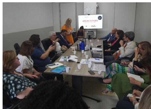
Elaboração de políticas e convênios Internacionais.