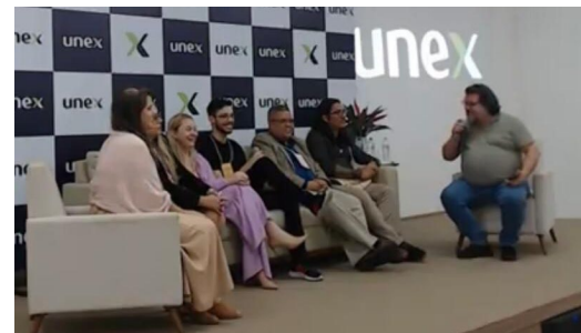
Organização de Evento de Saúde junto com a Rede Unida e a Unex