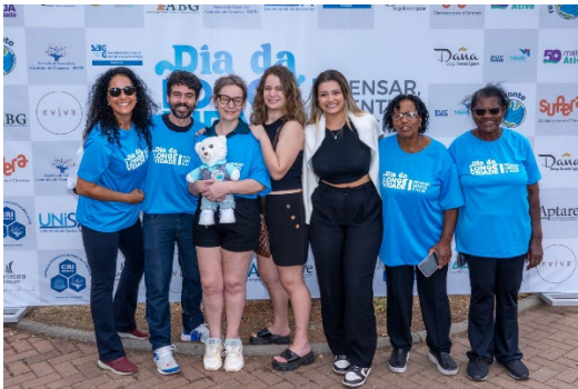
Participação no dia da Longevidade da SBGG em 2024

A Rede Geronto continua a expandir seu impacto global, atraindo participantes de todo o mundo e colaborando em pesquisas que buscam melhorar a qualidade de vida dos idosos. Nosso compromisso com a educação e o avanço do conhecimento em gerontologia tem promovido mudanças significativas nas políticas de saúde e na compreensão do envelhecimento, tornando o mundo um lugar mais inclusivo e respeitoso para todos.